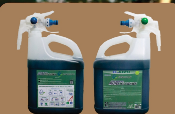
Sistema FILL 2 dosagens distintas