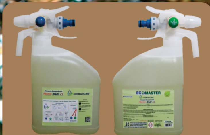
Sistema FOAM aplicação Direta Espuma e Enxágue